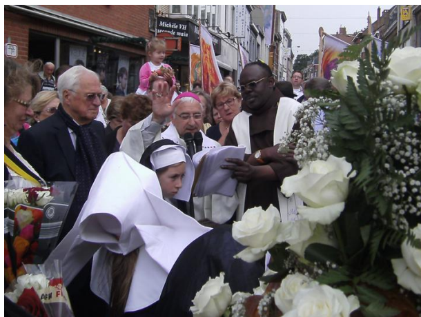
La bénédiction du Wastia au bas de la rue de Namur