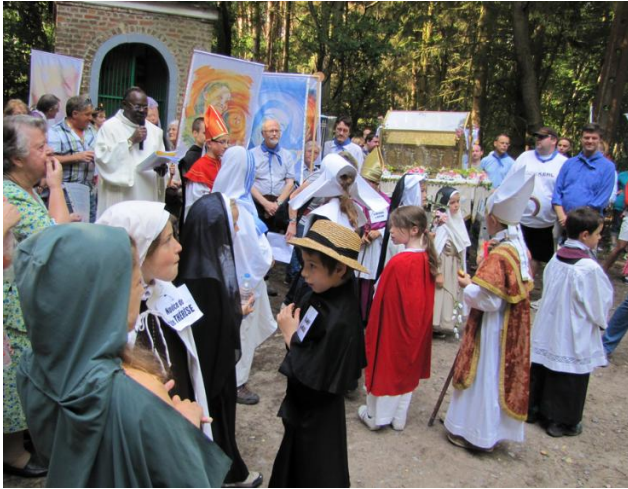
Les enfants portant des habits de saints de la châsse accompagnent la procession