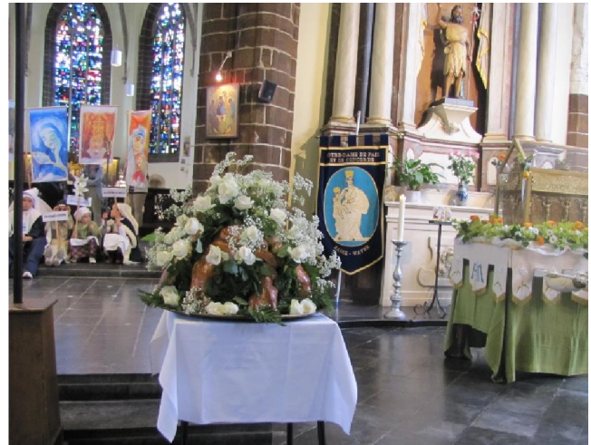
Accueil de la châsse à l'église St Jean-Baptiste