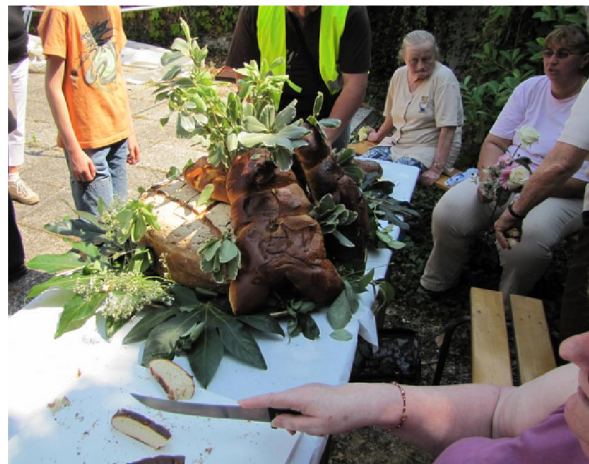
Le partage du Wastia à la basilique