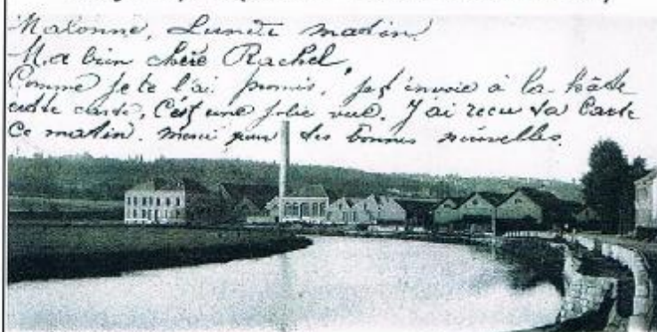
Malonne La Majolique et le Dépôt du Vicinal.